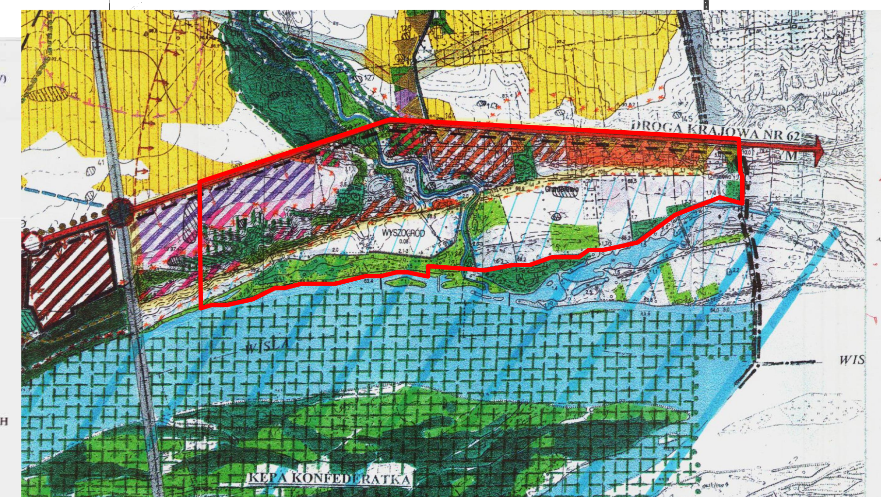
WYRYS ZE ZMIANY STUDIUM UWARUNKOWAN I KIERUNKÓW ZAGOSPODAROWANIA PRZESTRZENNEGO GMINY I MIASTA WYSZOGRÓD

Przebieg linii zabudowy Skala 1:2000 Wzrost: 20.00m, 25.00m, 30.00m, 35.00m, 40.00m, 45.00m, 50.00m, 55.00m, 60.00m, 65.00m, 70.00m, 75.00m, 80.00m, 85.00m, 90.00m, 95.00m, 100.00m Ciepota: 10.00, 15.00, 20.00, 25.00, 30.00, 35.00, 40.00, 45.00, 50.00, 55.00, 60.00, 65.00, 70.00, 75.00, 80.00, 85.00, 90.00, 95.00, 100.00 Powierzchnia: 100, 200, 300, 400, 500, 600, 700, 800, 900, 1000, 1100, 1200, 1300, 1400, 1500, 1600, 1700, 1800, 1900, 2000, 2100, 2200, 2300, 2400, 2500, 2600, 2700, 2800, 2900, 3000, 3100, 3200, 3300, 3400, 3500, 3600, 3700, 3800, 3900, 4000, 4100, 4200, 4300, 4400, 4500, 4600, 4700, 4800, 4900, 5000, 5100, 5200, 5300, 5400, 5500, 5600, 5700, 5800, 5900, 6000, 6100, 6200, 6300, 6400, 6500, 6600, 6700, 6800, 6900, 7000, 7100, 7200, 7300, 7400, 7500, 7600, 7700, 7800, 7900, 8000, 8100, 8200, 8300, 8400, 8500, 8600, 8700, 8800, 8900, 9000, 9100, 9200, 9300, 9400, 9500, 9600, 9700, 9800, 9900, 10000