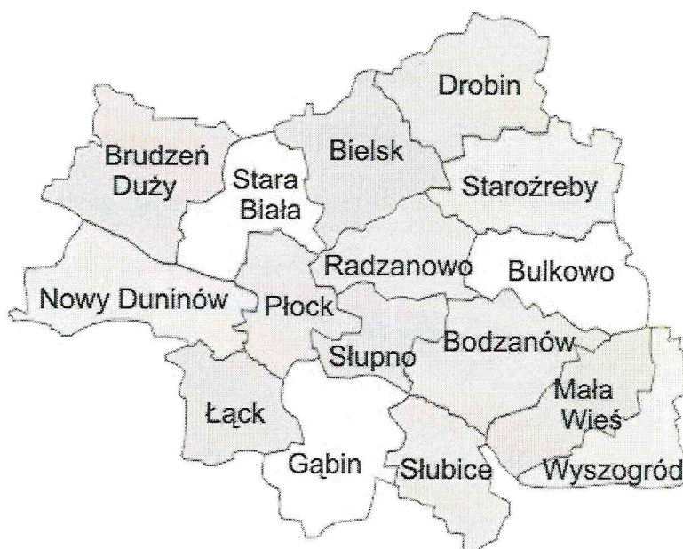
Rysunek 1. Gmina i Miasto Wyszogród na tle powiatu plockiego

Gmina i Miasto Wyszogród położone jest w województwie mazowieckim. Oddalone jest od Płocka o 37 km oraz od Warszawy o 72 km, dlatego też pozostaje w obszarze bezpośrednich wpływów obu miast (społecznych, ekonomicznych, rekreacyjnych i infrastrukturalnych). W skład gminy i miasta wchodzi 17 sołectw, zaś terytorium gminy i miasta obejmuje obszar 96 km 2 .